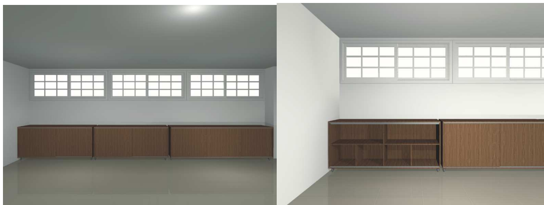
Figura ilustrativa Lote 02: